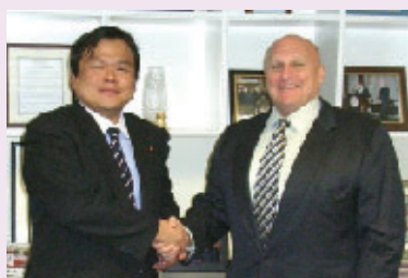
アーミテージ前国務副長官と面談(於:ワシントン)