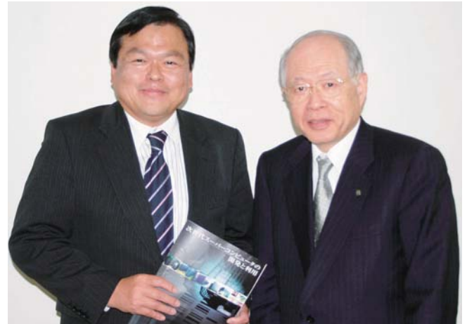
ノーベル化学賞・野依良治理化学研究所理事長等からスーパーコンピューターに関する要請を受ける