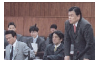
参院ODA等に関する特別委員会