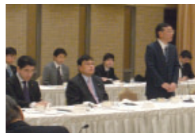
日本商工会議所(山口会場ほか)