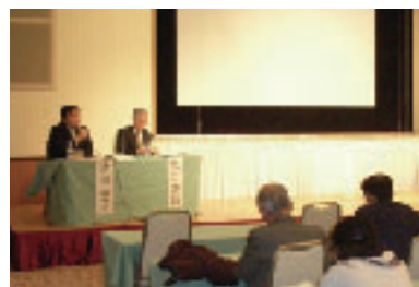
財政制度等審議会地方公聴会(仙台にて)