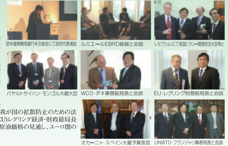
欧州復興開発銀行年次総会にて政府代表演説 ルミエールEBRD総裁と会談 レゾジョンにて英国ヒラリー開発担当大臣等と バヤルトサイハン・モンゴル大蔵大臣 WCO・ダネ事務総局長と会談 EU・レグリング財務総局長と会談 オカーニヤ・スペイン大蔵予算長官 UNWTO・フランジャリ事務局長と会談

英国・ロンドンで開催された欧州復興開発銀行(EBRD)の設立15周年年次総会にて政府代表演説を行う。 [EBRDとは、旧ソビエト、中・東欧諸国の民主化・市場経済改革を支援するため1991年に設立された国際開発金融機関]