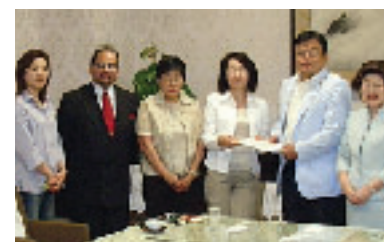
外国人学校協会から税制改正について