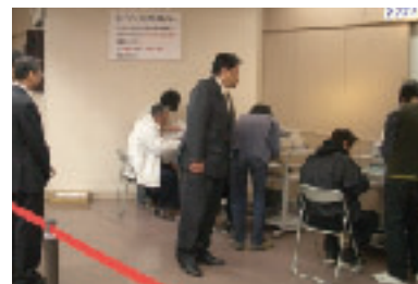
確定申告会場視察(兵庫区)