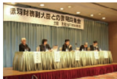
赤羽財務副大臣との意見交換会(高松にて)