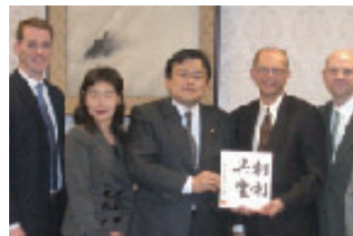
在日米国商工会議所