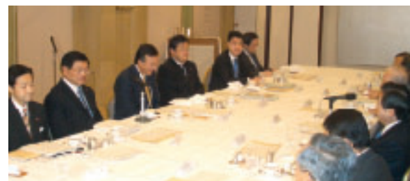
経済同友会(北城代表幹事ほか)