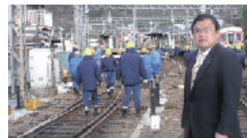
神戸電鉄脱線事故現場に急行