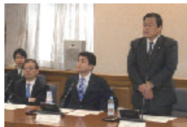
全国税関長会議にて訓示