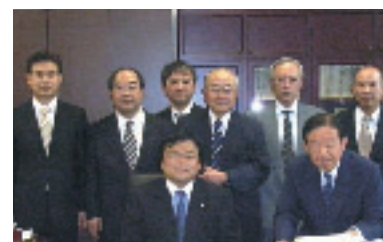
兵庫県トラック協会から道路特定財源について