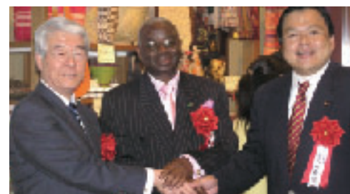
神戸空港「一村一品マーケット」開所式