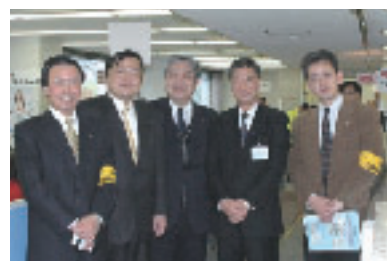
確定申告会場視察(長田区)