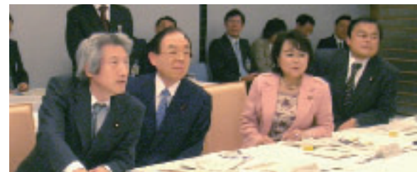
官邸にて総合科学技術会議(左端が小泉総理大臣)