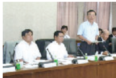
財政制度等審議会