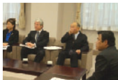
秋山関経連会長と阪神港の一元化について 井戸兵庫県知事と地方交付税について