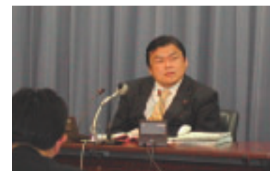
日銀政策決定会合(3月9日)後の記者会見