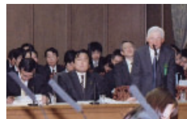
参院財政金融委員会(隣りは福井日銀総裁)