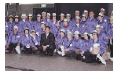
神戸シルバーカレッジ皇居奉仕団の方々と