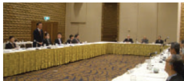
日本経済団体連合会(御手洗会場ほか)