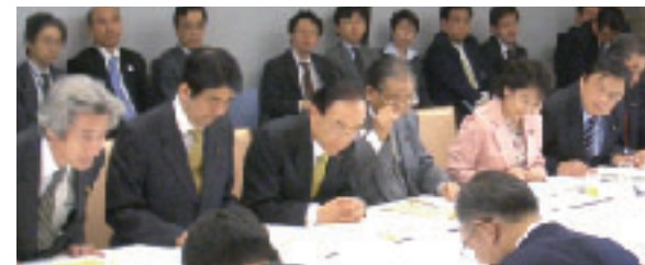
官邸にて知的財産戦略会議(左から、小泉総理大臣、安倍官房長官)