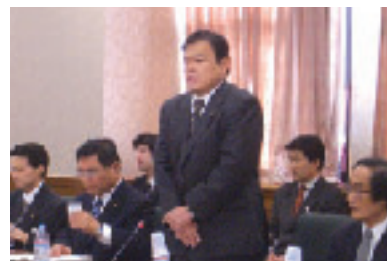
全国財務局長会議にて挨拶