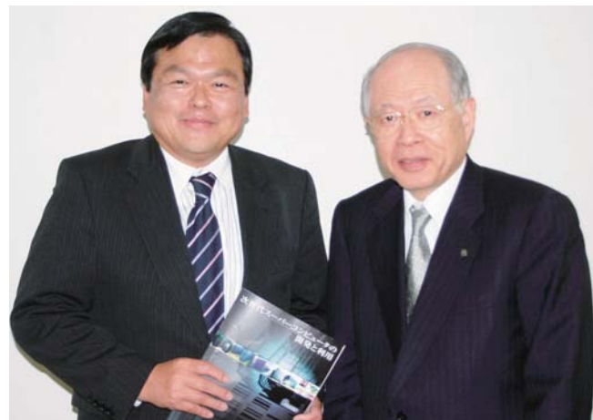
ノーベル化学賞・野依良治理化学研究所理事長等からスーパーコンピューターに関する要請を受ける