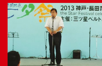
神戸市長田区での地域の集い「七夕祭」であいさつ。