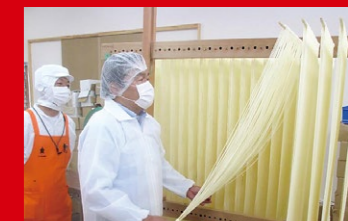
宮城県白石市での「ちいさな企業・成長本部」で、白石湯麺の製造に挑戦。