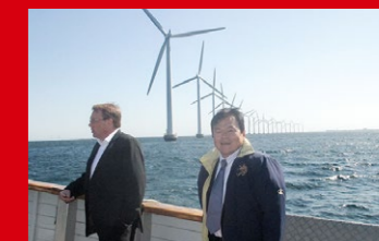
再生可能エネルギー先進国のデンマークの洋上風力発電の現場視察。