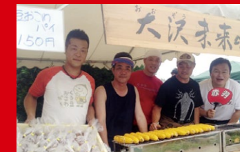
北区大沢の泥んこパレー会場で、黒豆おこわとトウモロコシの売り場で「大沢未来の会」のメンバーと。