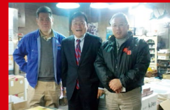
神戸市兵庫区の中央卸売市場で、仲卸の皆さんと年末商戦の繁盛を祈って。