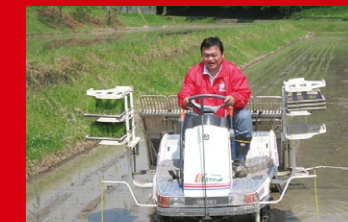
地元・神戸市北区で、耕耘機・初体験。美味しい米の豊作を祈願しつつ。