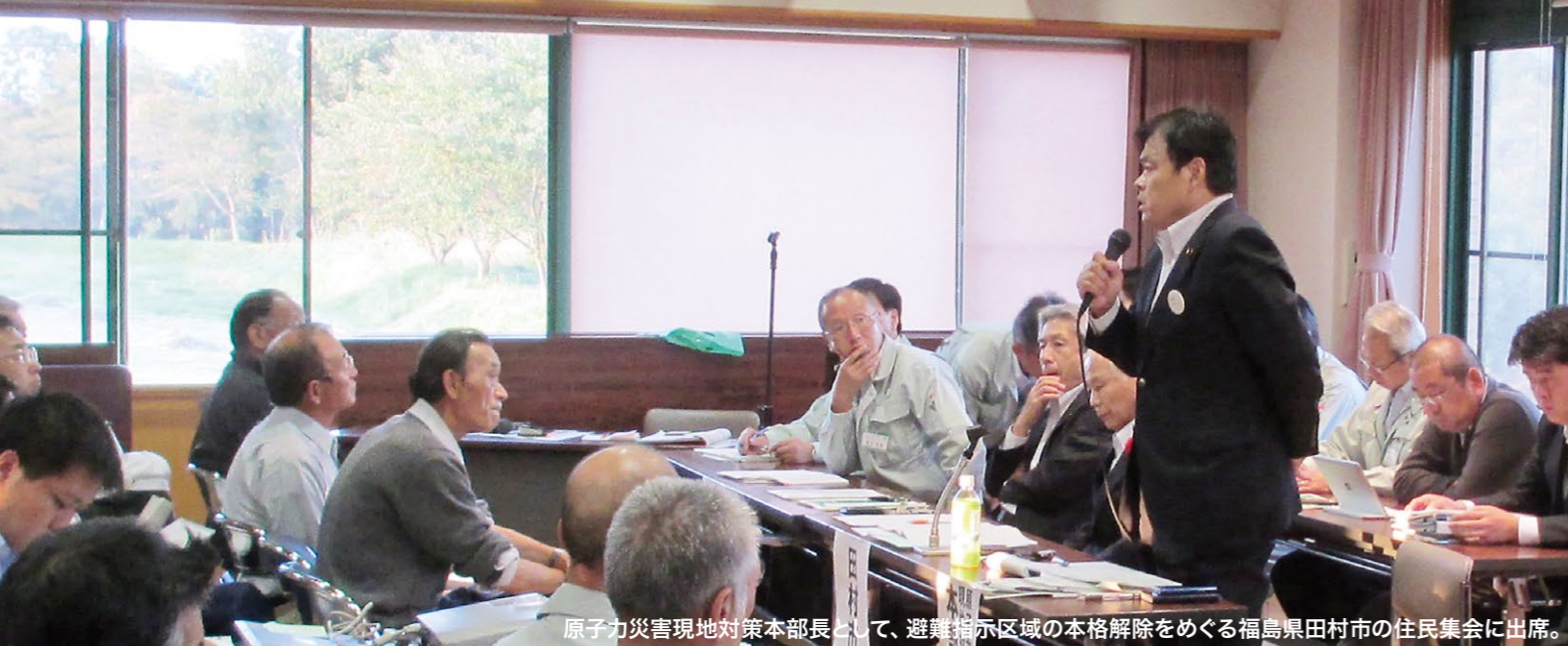
原子力災害現地対策本部長として、避難指示区域の本格解除をめぐる福島県田村市の住民集会に出席。