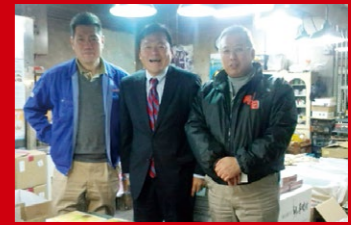
神戸市兵庫区の中央卸売市場で、仲卸の皆さんと年末商戦の繁盛を祈って。