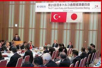
第21回日本トルコ合同経済委員会、わが国経済政策についての基調講演。