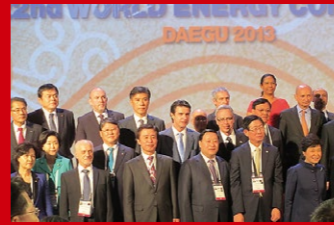
第22回世界エネルギー会議(120ヶ国7000名参加)の開会式にて、各国閣僚とともに記念撮影(韓国テグ市)