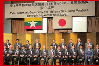
ミャンマー・ティラワ経済特別区の日本ミャンマー共同事業体の設立式典に参加。