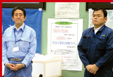
安倍総理と共に福島第一原発の現場視察後、職員の方々に感謝。