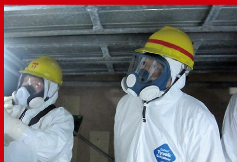
福島第一原発4号機の中を防護服姿で立入視察。