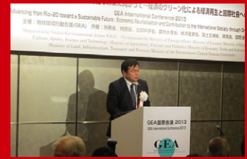
Global Environmental Action (地球環境行動会議) 2013にて、政府を代表してのスピーチ。