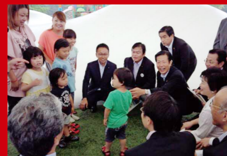
山口公明党代表らと共に福島市内の避難児童の遊戯場で、避難家族の皆様をお見舞い。