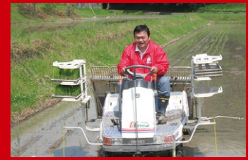
地元・神戸市北区で、耕耘機・初体験。美味しい米の豊作を祈願しつつ。