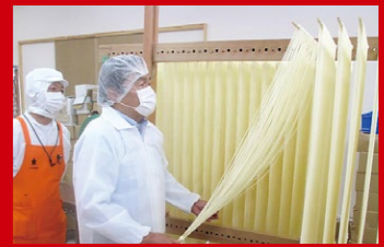
宮城県白石市での「ちいさな企業・成長本部」で、白石温麺の製造に挑戦。