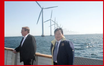
再生可能エネルギー先進国のデンマークの洋上風力発電の現場視察。