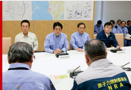
九州電力・川内原発にて全面緊急事態が発生した想定で実施された平成25年度原子力総合防災訓練に参加(於:首相官邸)。

阪神・淡路大震災での被災体験を生かし、地元被災者の方と共に悩み、そして共に汗を流しながら、「負けたらあかん!」の精神で、必ず人類史上初の挑戦をやり遂げます。