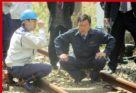
JR常磐線の早期復旧に向けて、放射線量チェックの現場視察。