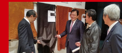
天然皮革の良さをPRするイベント、たつの市皮革まつり

場で取扱う安心な青果物や瀬戸内海や日本海の魚介類を堪能する。そして、たつや姫路の皮革を活用した長田の神戸シューズや豊岡のカバン等の革製品を世界のトップブランドに育成する等々、観光立国の推進はそのまま兵庫創生に直結するのです。今年も兵庫創生へ全力投球します。