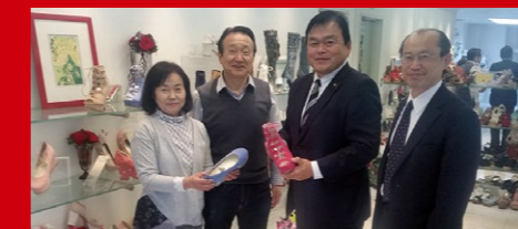
「くつのまち ながた」、長田ケミカルシューズを視察

また、兵庫には大なる潜在力があります♥。豊臣秀吉公も愛した世界一の有馬温泉に宿泊し、ユニバーサルスタジオオや京都や琵琶湖だけでなく、姫路城や淡路島を起点とした瀬戸内海クルーズを楽しむ。さらに神戸ビーフや灘五郷の日本酒や、神戸市中央卸売市