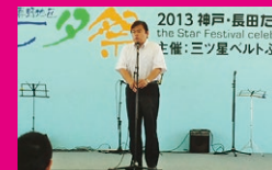
神戸市長田区での地域の集い「七夕祭」であいさつ。