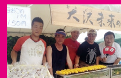
北区大沢の泥んこパレー大会で、「大沢未来の会」のメンバーと。