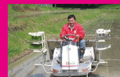
地元・神戸市北区で、耕耘機・初体験。美味しい米の豊作を祈願しつつ。