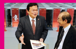
スーパーコンピューター「京」の誘致に貢献。