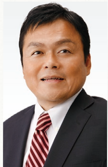
衆議院議員 赤羽かずよし