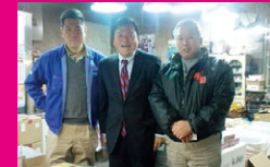
神戸市兵庫区の中央卸売市場で、仲卸の皆さんと年末商戦の繁盛を祈って。