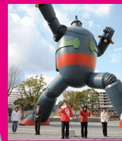
長田区鉄人広場にて地元地方議員と地場産業の再生に尽力。